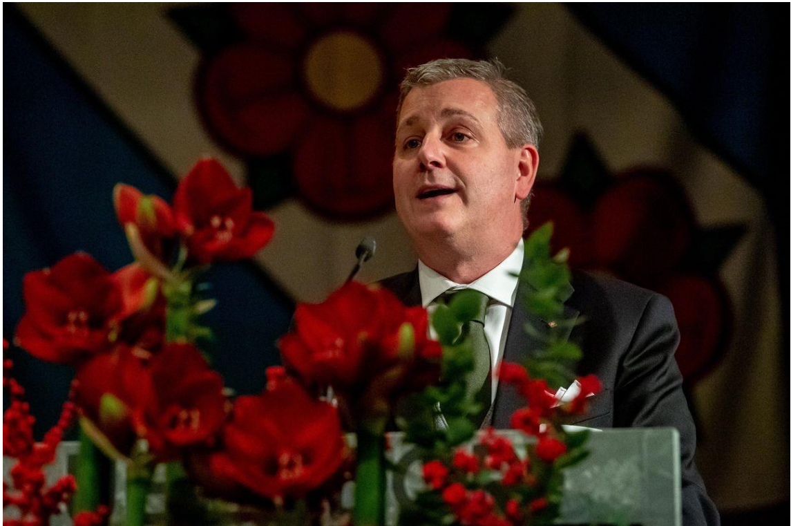
Marco Chiesa, Ständerat und Parteipräsident SVP