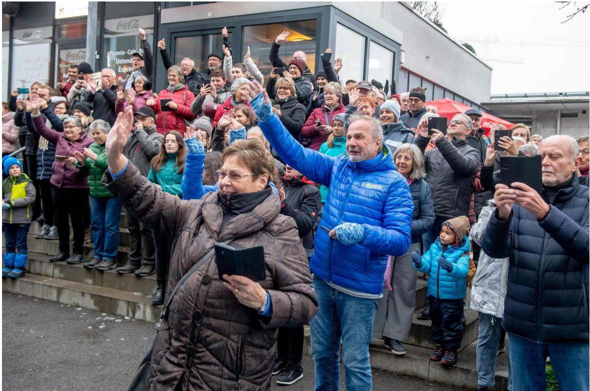
Die Menge ist begeistert und winkt Albert Rösti zu.