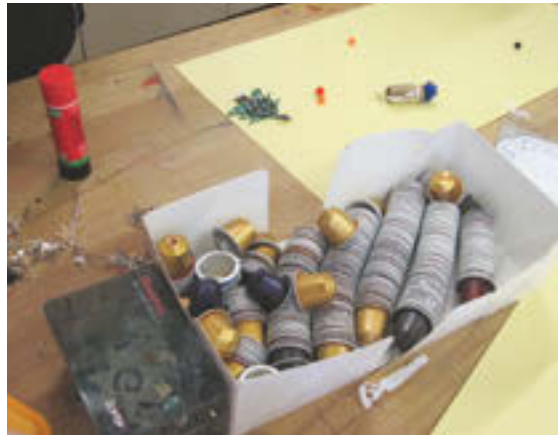
Aus leeren Nespressokapseln werden Engel.