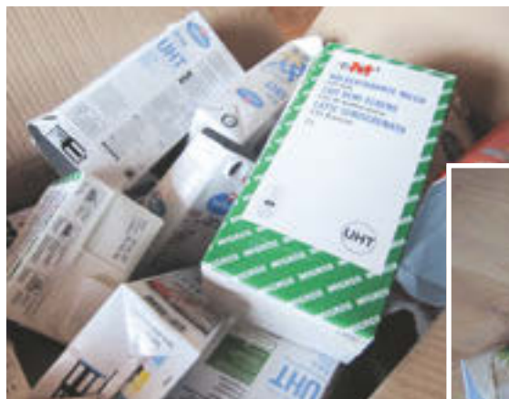
Aus leeren Getränkekartons werden Portemonnaies.