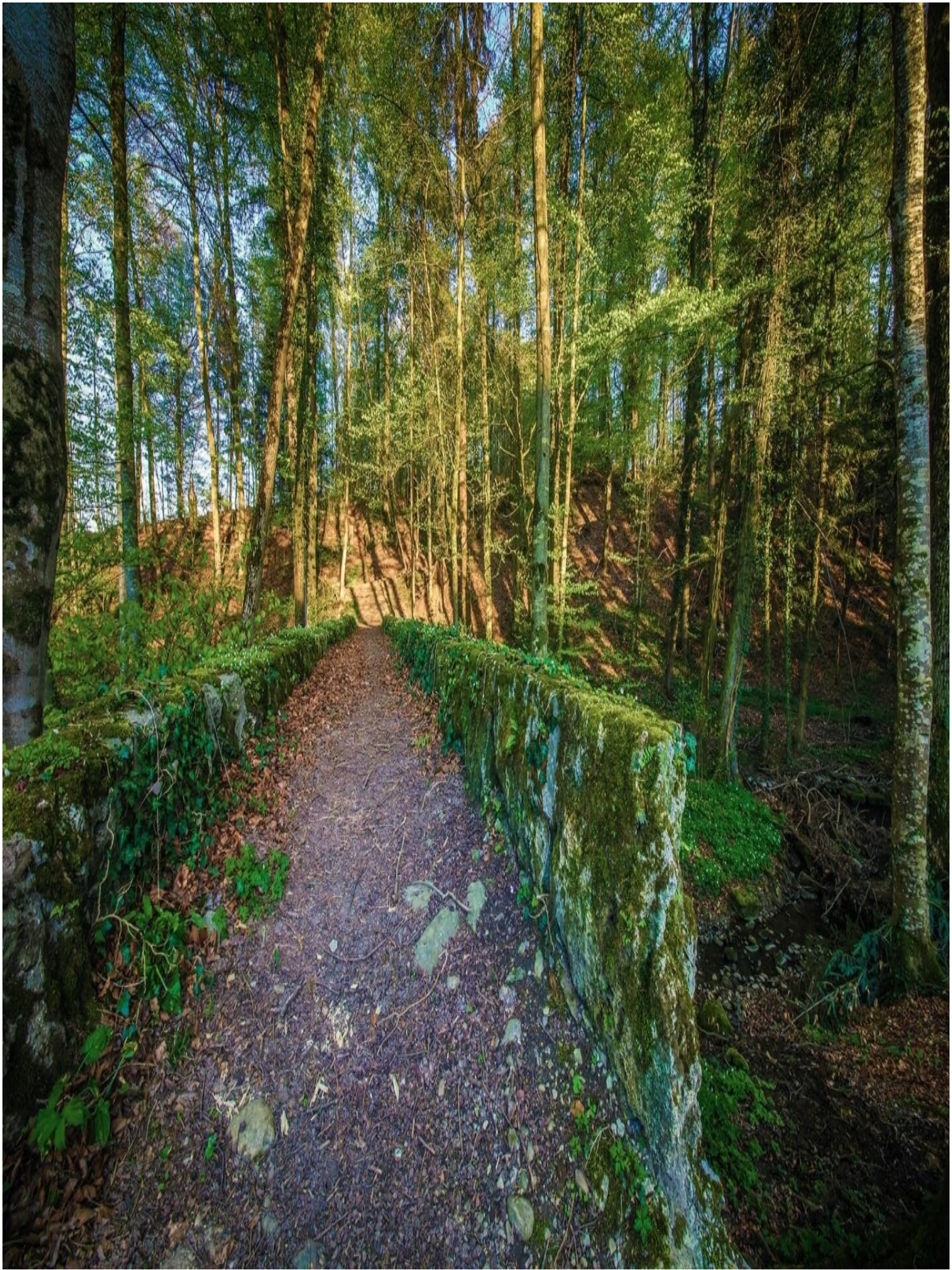
Wir überqueren den Bach unten bei der Brücke und folgen der Strasse dem Bahngleis entlang. Bei der Gabelung wandern wir den Weg links hoch Richtung Gurzelen.