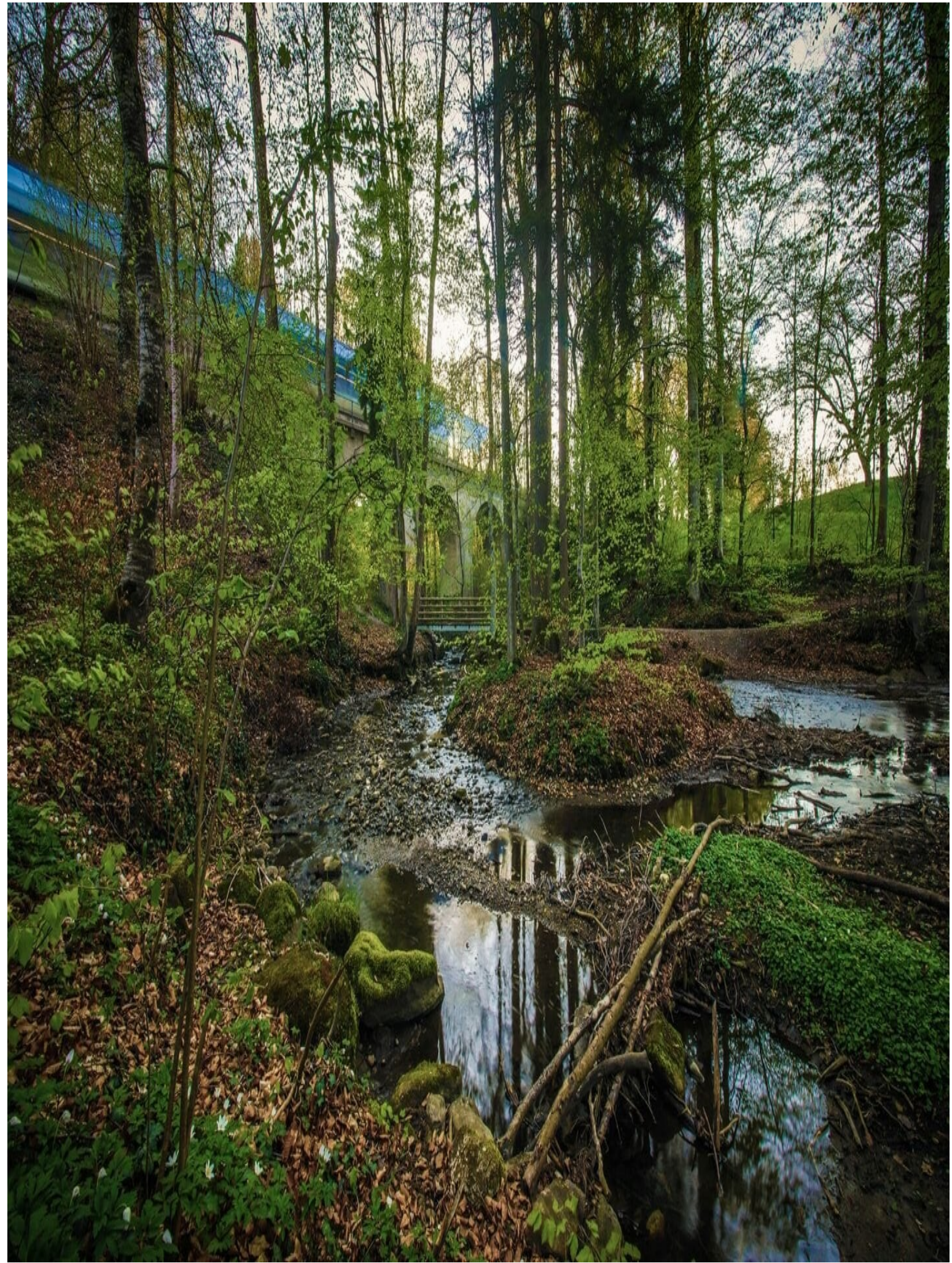
Eine Besonderheit ist das sogenannte „Römerbrüggli“, das den Amletebach im oberen Talabschnitt quert.